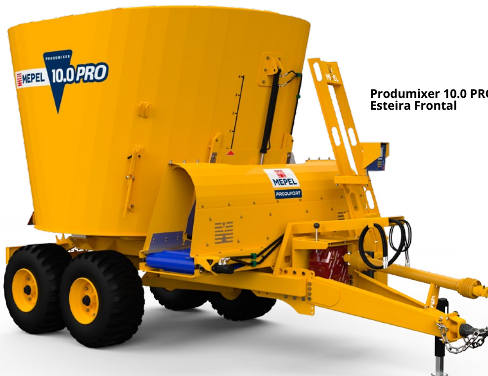
Prodimixer 10.0 PRO Esteira Frontal