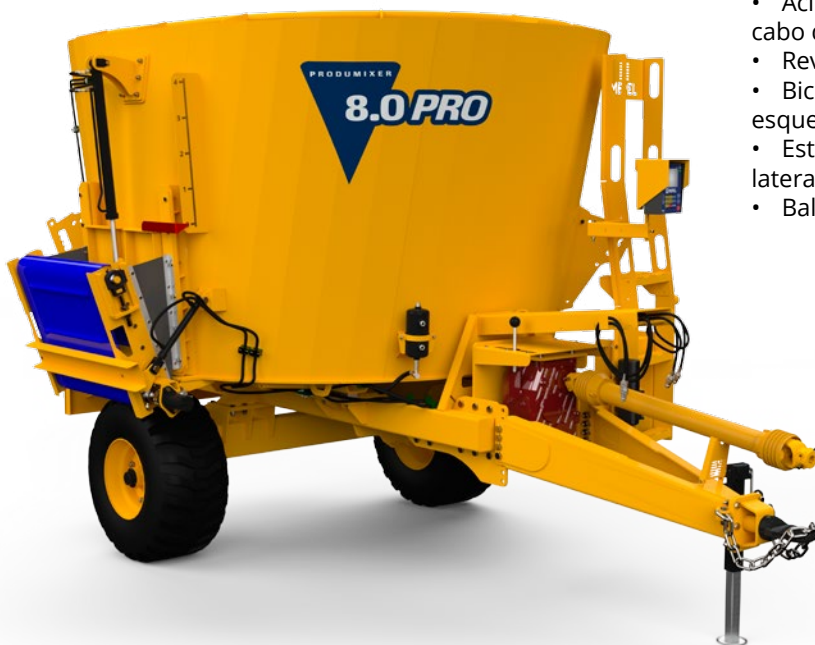
Prodimixer 8.0 PRO Esteira Lateral