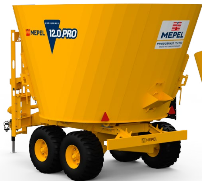
Produmixer 12.0 PRO Bica Lateral