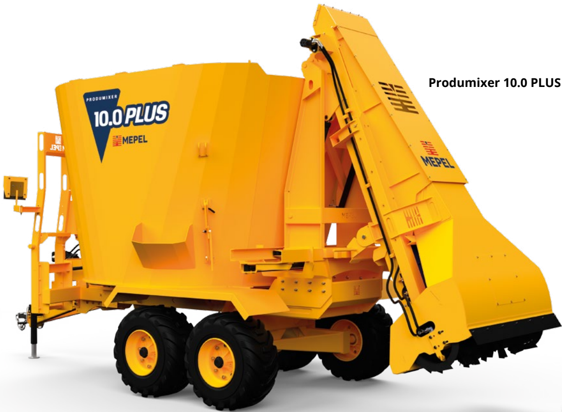
Prodimixer 10.0 PLUS