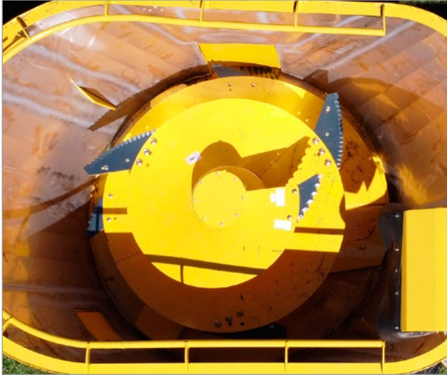
Misturador com facas de corte