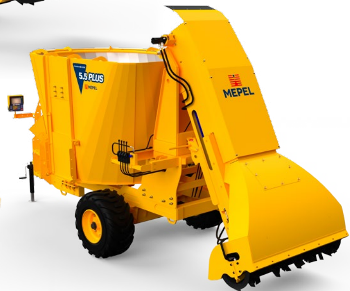
Prodimixer 5.5 PLUS