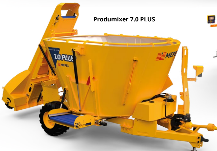
Prodimixer 7.0 PLUS