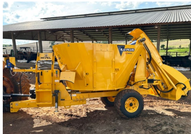
Produmixer 4.0 PLUS