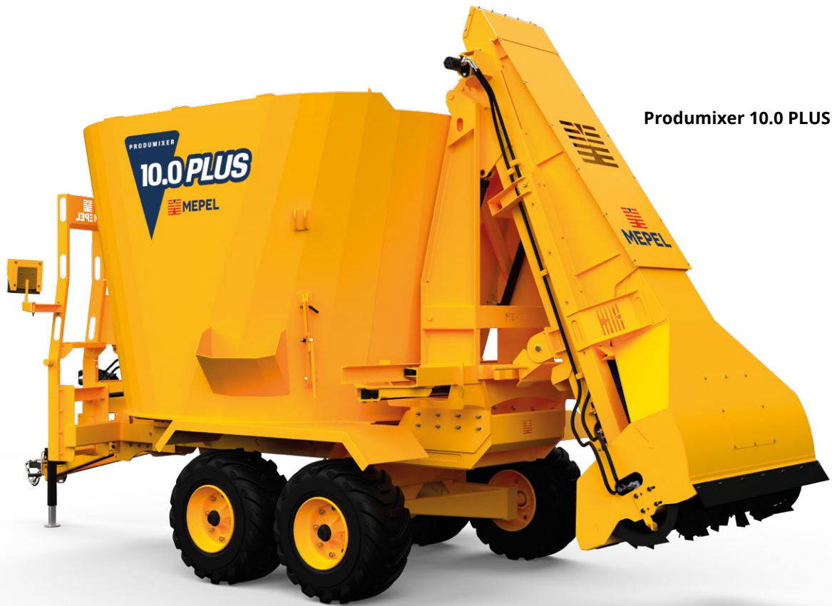
Produmixer 10.0 PLUS