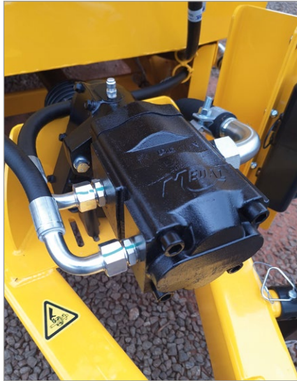
Sistema hidráulico de bomba dupla