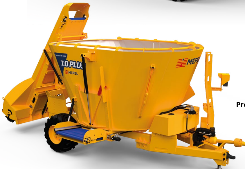
Produmixer 7.0 PLUS