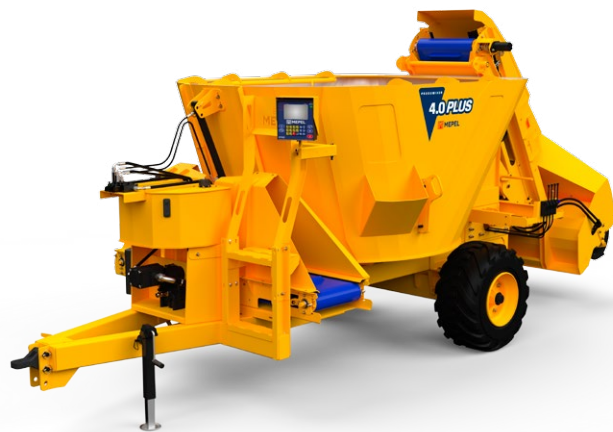
Produmixer 4.0 PLUS