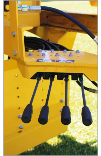
Comandos de operação