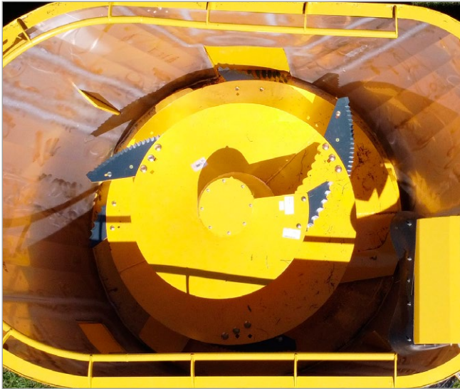
Misturador com facas de corte