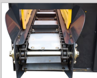
Esteira de corrente com taliscas