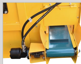
Esteira de lona com taliscas