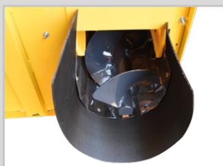
Caracol em aço INOX