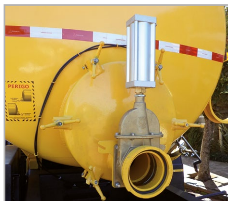
Tampa de inspeção de 550 mm com registro de carga de 6"