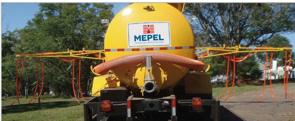
Possibilidade de 7 a 10 linhas de distribuição de vinhoto concentrado