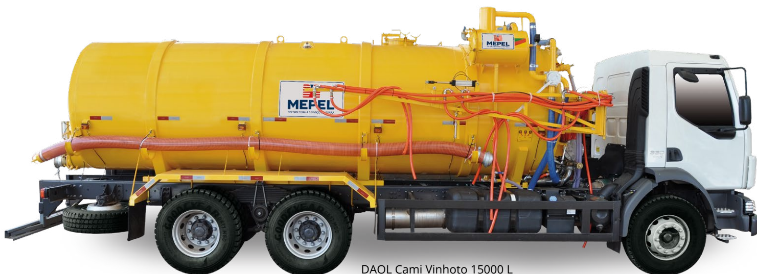
DAOL Cami Vinhoto 15000 L