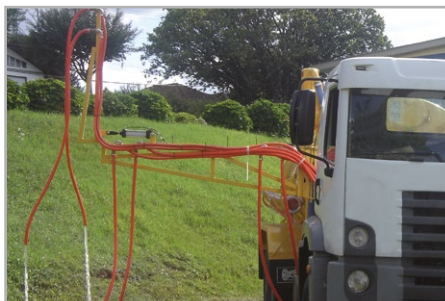
Barras retráteis para facilitar o deslocamento e aplicação