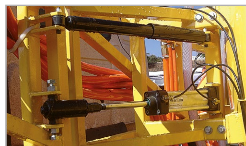
Sistema pneumático de acionamento das barras