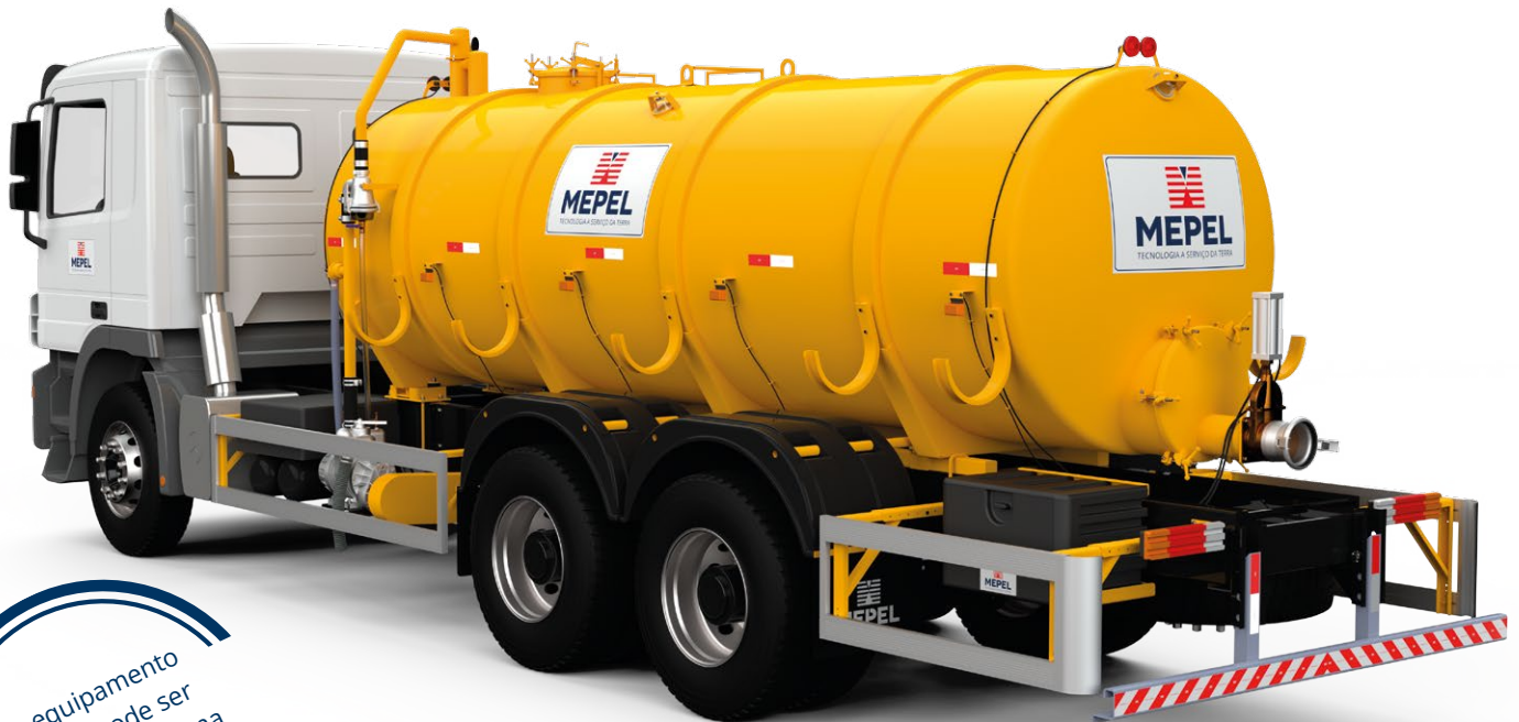
DAOL Cami Vácuo Compressor 10000 L

Este equipamento também pode ser instalado no sistema ROLL ON/OFF