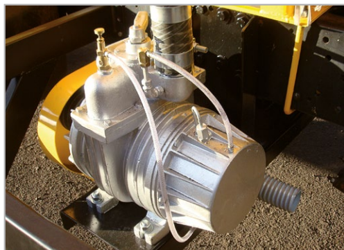
Bomba vácuo e pressão de 7 palhetas, com vazão de ar de 5,0 m 3 /min (300 m 3 /h)