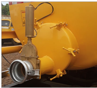
Tampa de inspeção traseira e pistão pneumático de abertura do registro