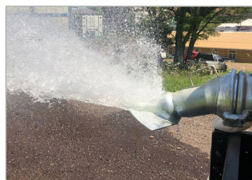
Bico leque aspersion