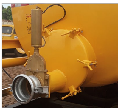
Tampa de inspeção traseira e pistão pneumático de abertura do registro