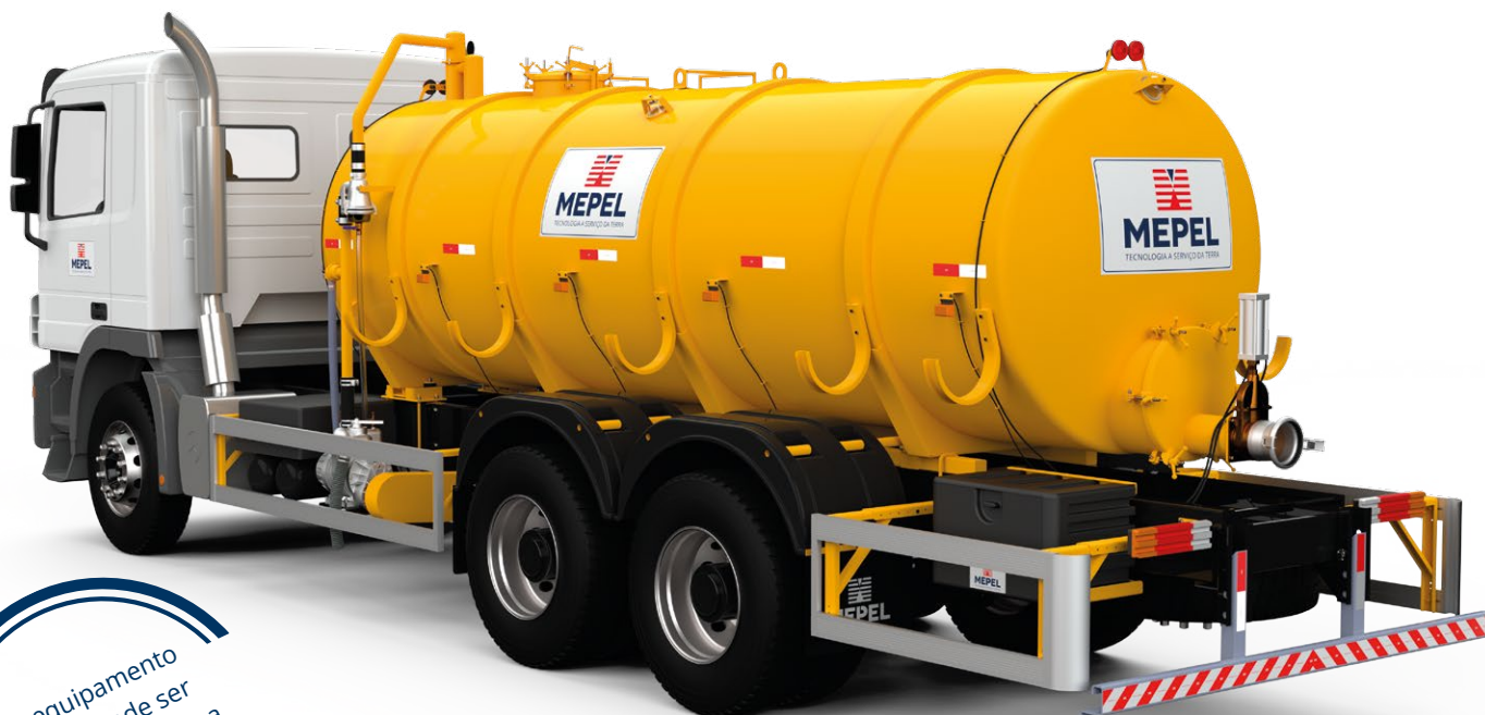
DAOL Cami Vácuo Compressor 10000 L

Este equipamento também pode ser instalado no sistema ROLL ON/OFF