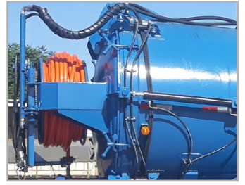
Carretel hidráulico 1" com 120m e sistema de hidrojateamento com bomba de alta pressão