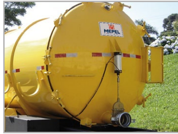
Tampa de inspeção torrisférica com abertura total manual