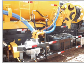
Carretel manual com mangueira hidráulica 1" com 60 m e sistema de hidrojateamento com bomba de alta pressão