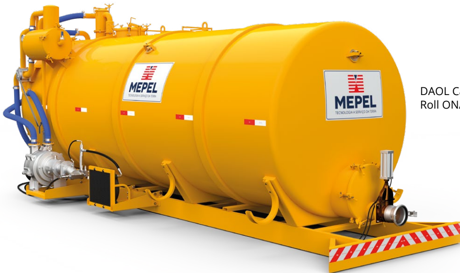
DAOL Cami Vácuo Anel Líquido Roll ON/Off 15000 L