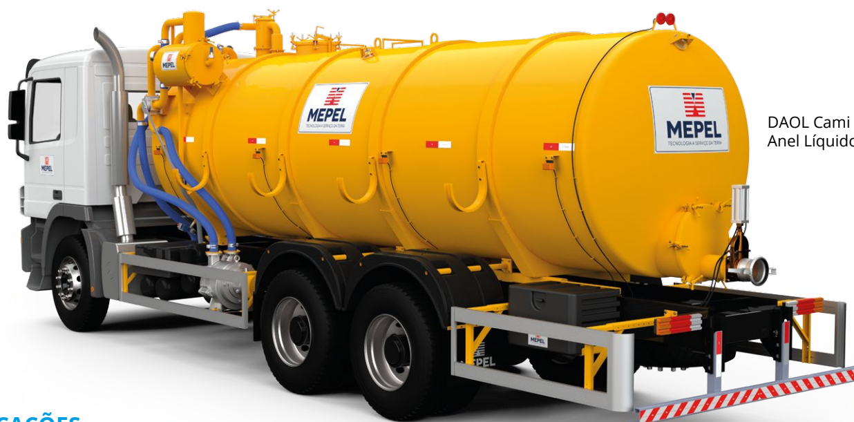
DAOL Cami Vácuo Anel Líquido 15000 L