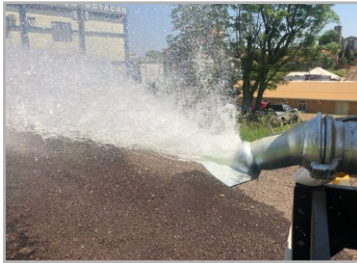
Bico leque aspersor