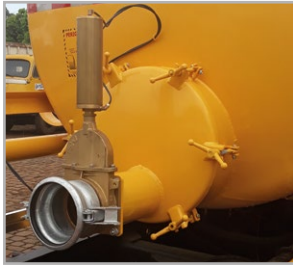
Tampa de inspeção de 550 mm e pistão pneumático de abertura do registro