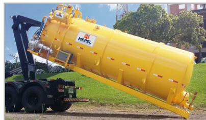
DAOL Cami com acionamento da Bomba Anel Líquido por motor hidráulico acionado através da bomba hidráulica do Roll On/Off com trocador de calor.