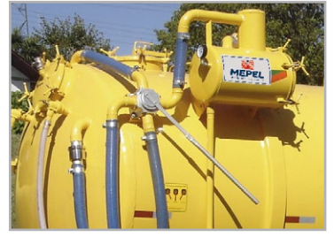
Válvulas 4 vias para carga e descarga