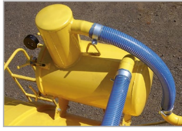
Sifão (válvula para evitar que resíduos entrem na bomba)