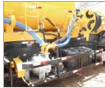
Carretel manual com mangueira hidráulica 1" com 60 m e sistema de hidrojateamento com bomba de alta pressão