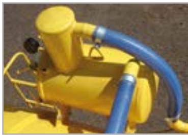
Sifão (válvula para evitar que resíduos entrem na bomba)