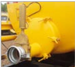
Tampa de inspeção de 550 mm e pistão pneumático de abertura do registro