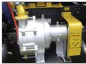
Bomba vácuo e pressão anel líquido 12 m 3 /min de vazão de ar