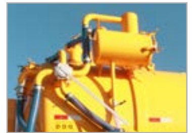
Válvulas 4 vias para carga e descarga