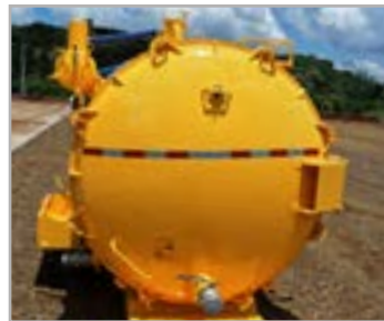
Tampa de inspeção torisférica com abertura total manual