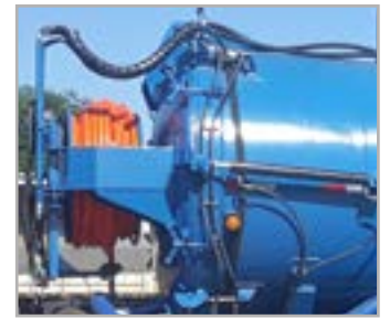
Carretel hidráulico 1" com 120m e sistema de hidrojateamento com bomba de alta pressão