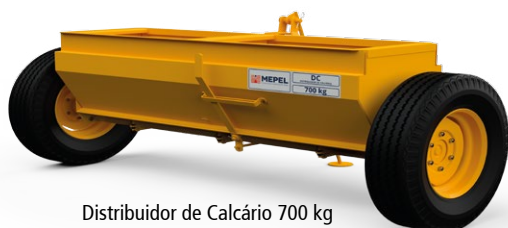
Distribuidor de Calcário 700 kg