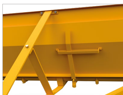
Regulagem do dosador de calcário.