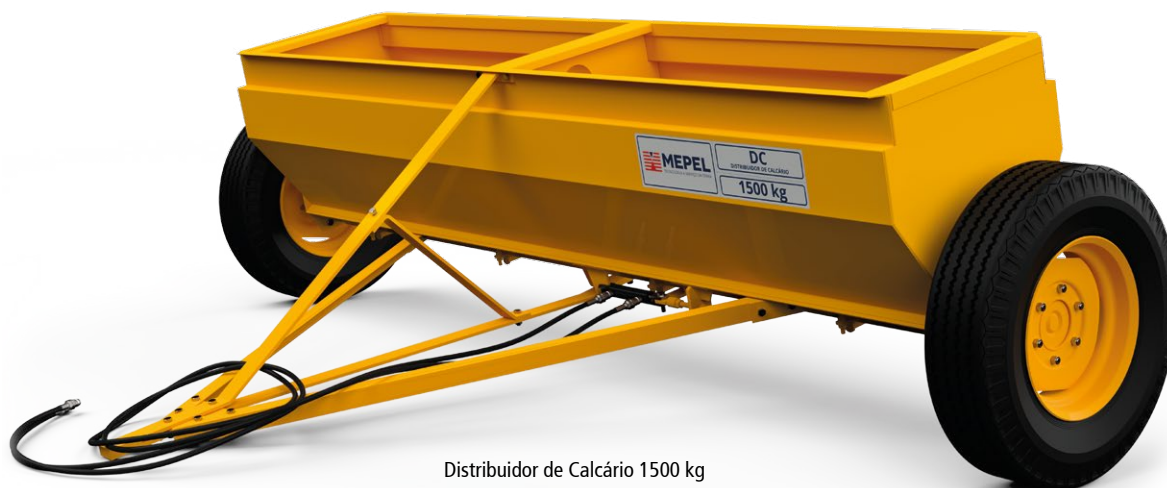
Distribuidor de Calcário 1500 kg