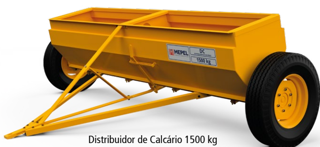
Distribuidor de Calcário 1500 kg