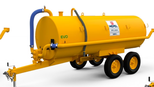
DAOL Lobular 5000 EVO Tandem aro 16"