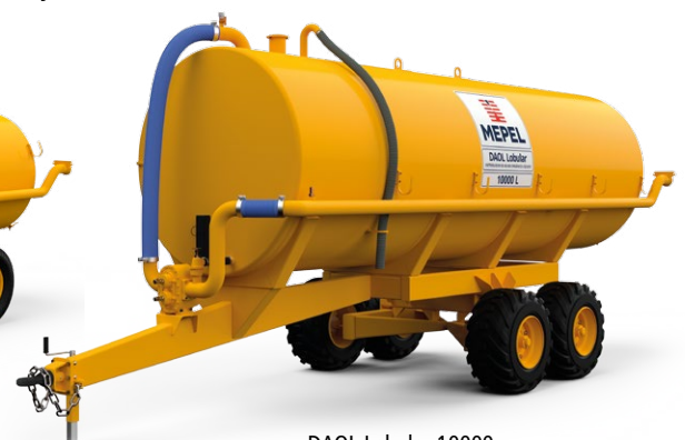
DAOL Lobular 10000 Tandem aro 15,5"