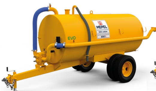
DAOL Lobular 4000 EVO 1ERD aro 16"