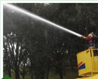
→ Canhão monitor com alcance de até 60 m