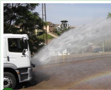
→ Bico leque aspersor dianteiro