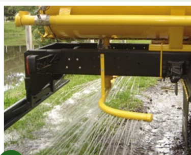
→ Barra irrigadora traseira