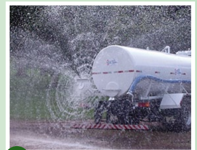
→ Bico leque aspersor traseiro