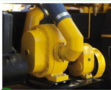
→ Bomba lobular 5" vazão de 90 m 3 /h e pressão de 10 kg/cm 2